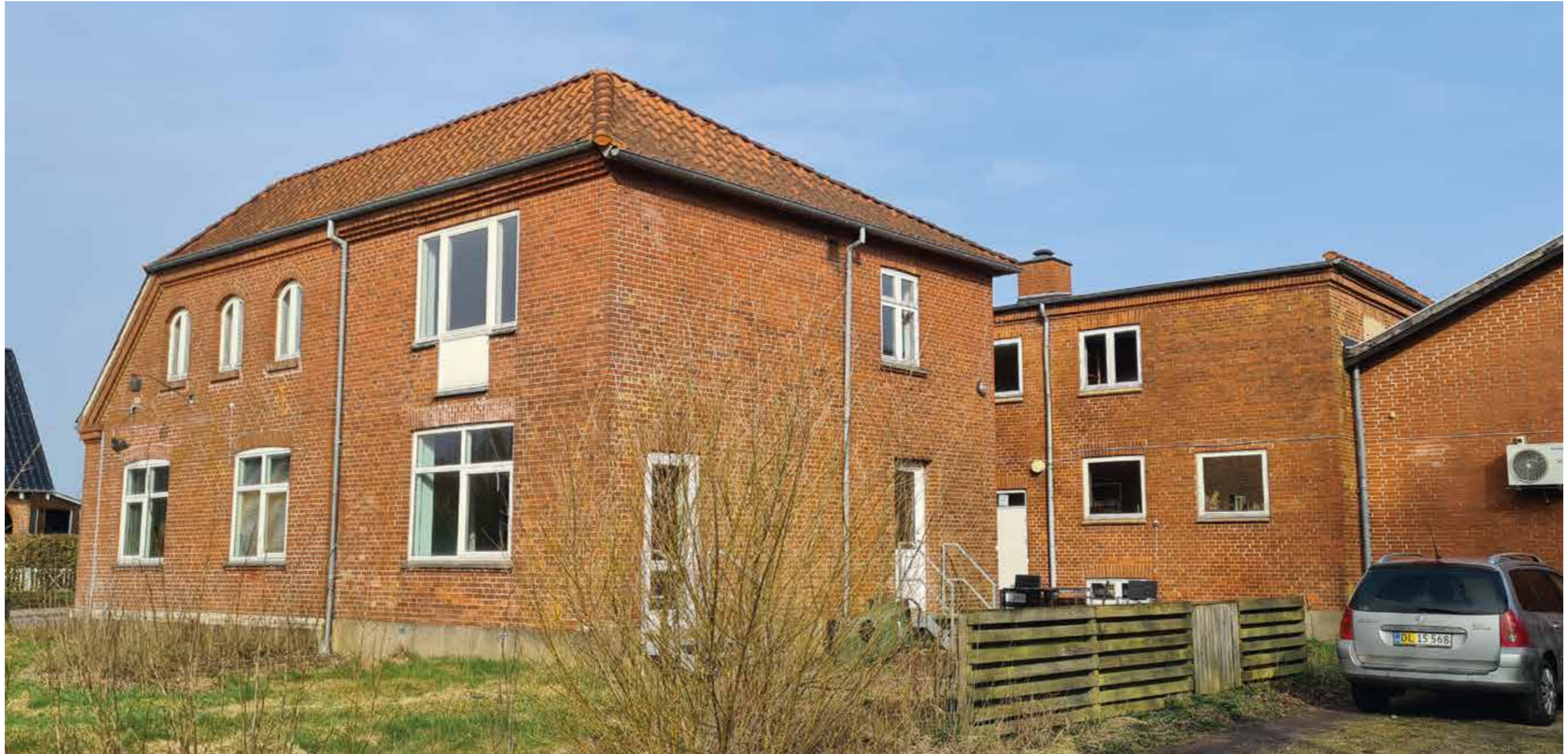
Bolig- og lagerbygningen idag