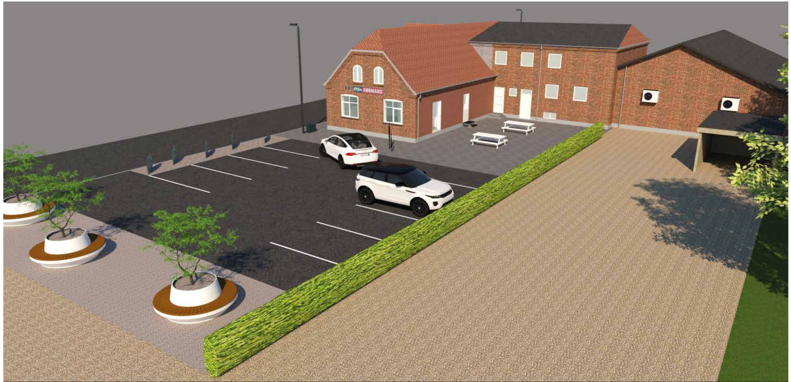
Overblik med parkeringsplads