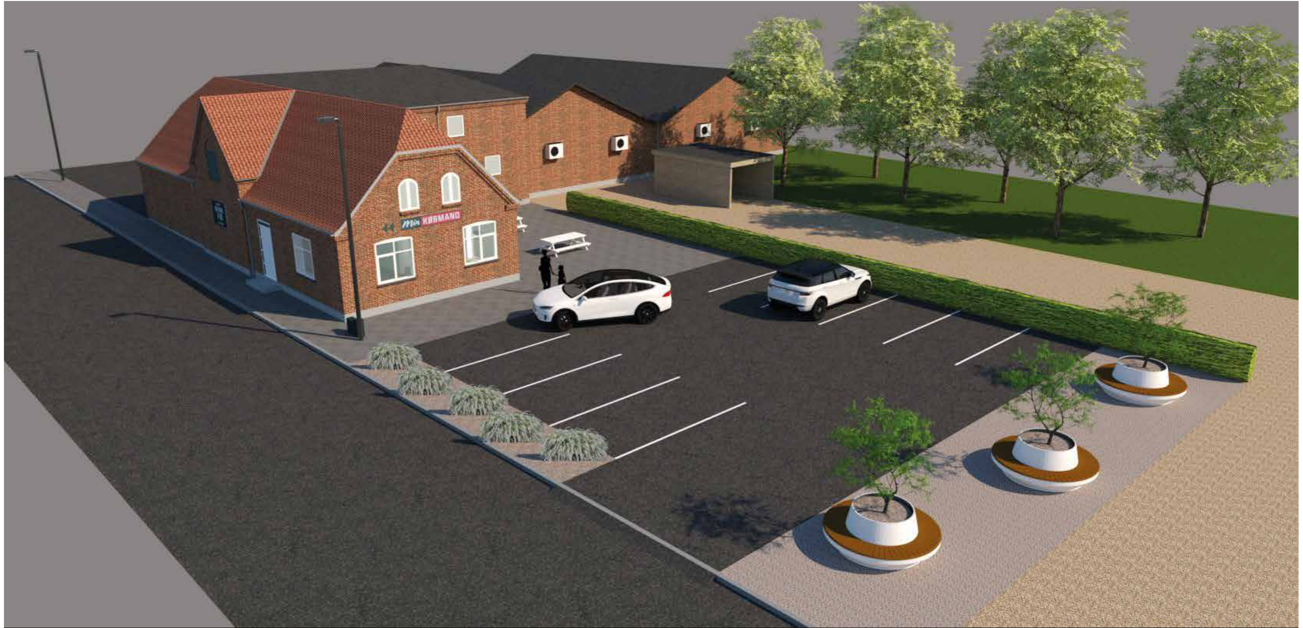
Overblik med parkeringsplads