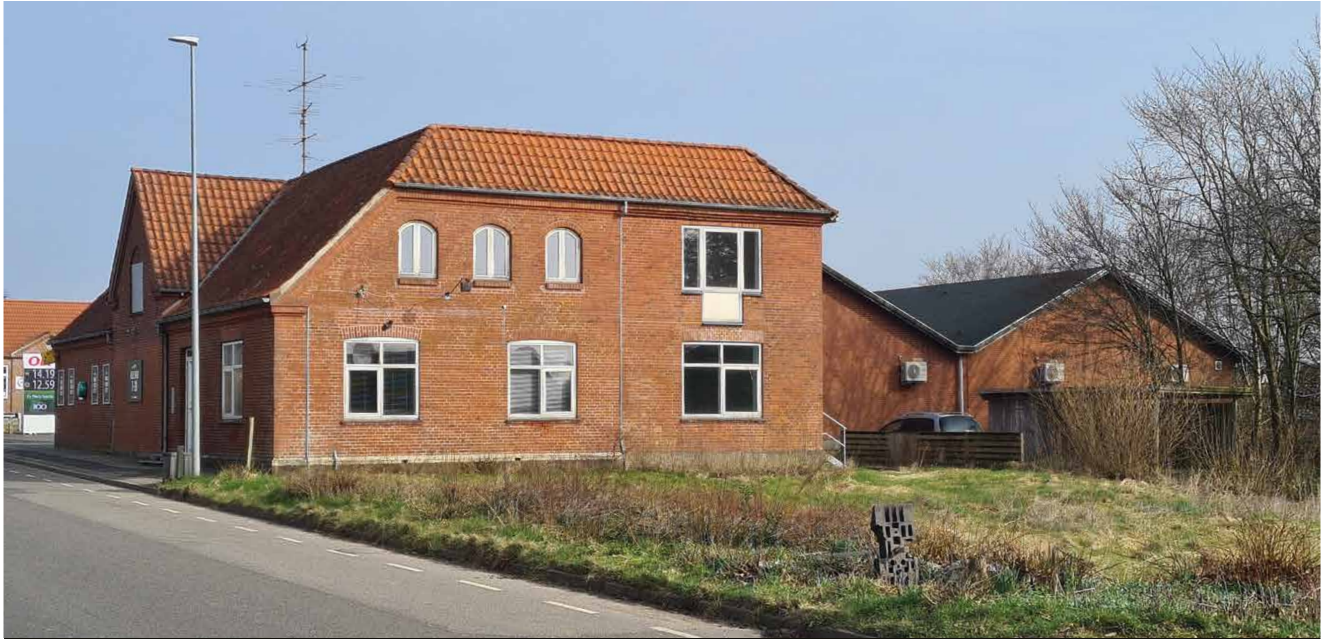
Bolig- og lagerbygningen idag