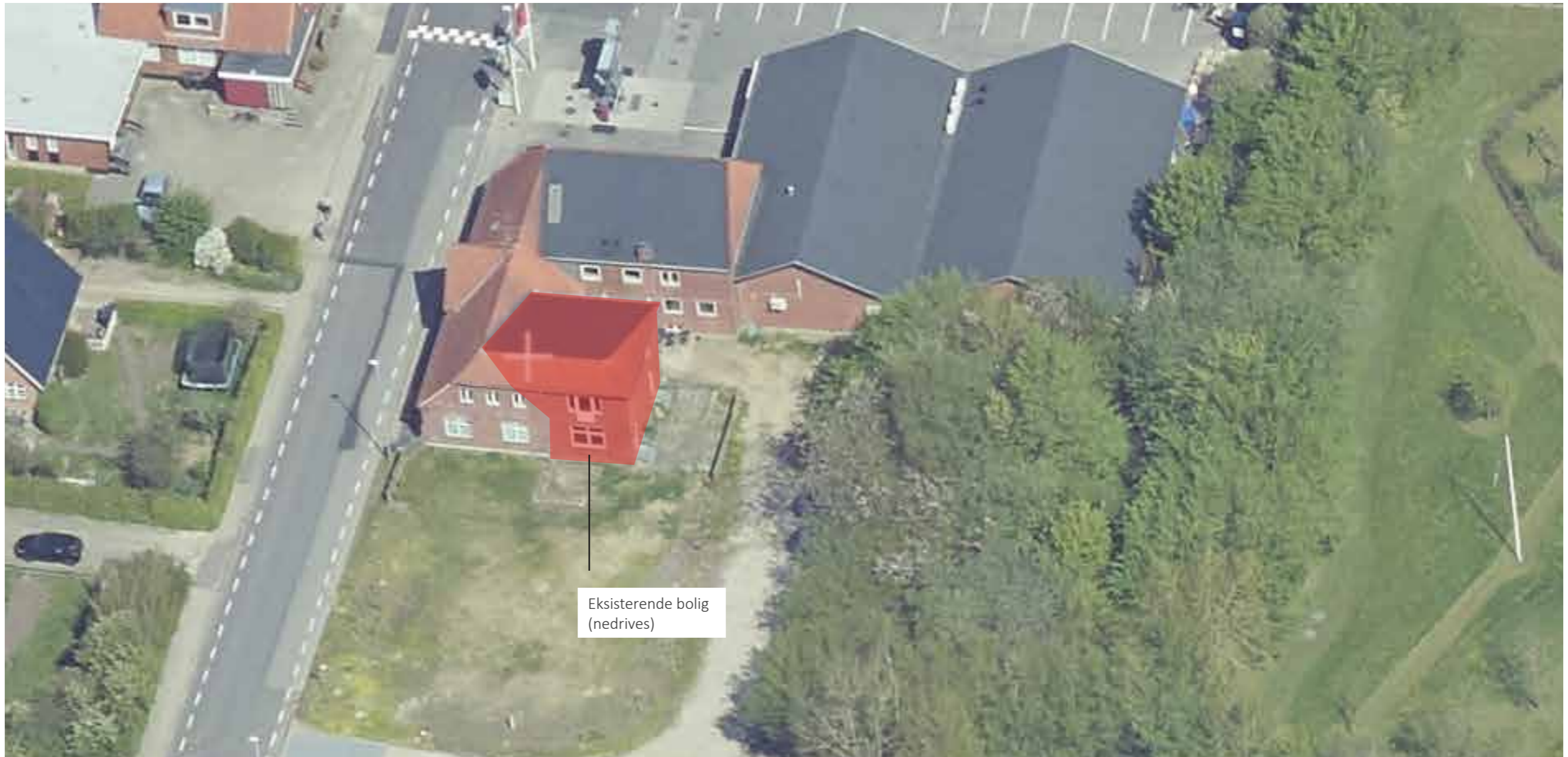
Oversigtsfoto set fra syd