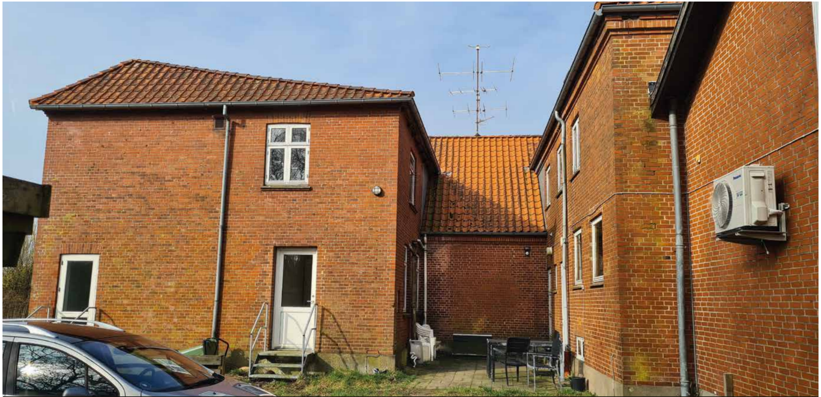
Bolig- og lagerbygningen idag