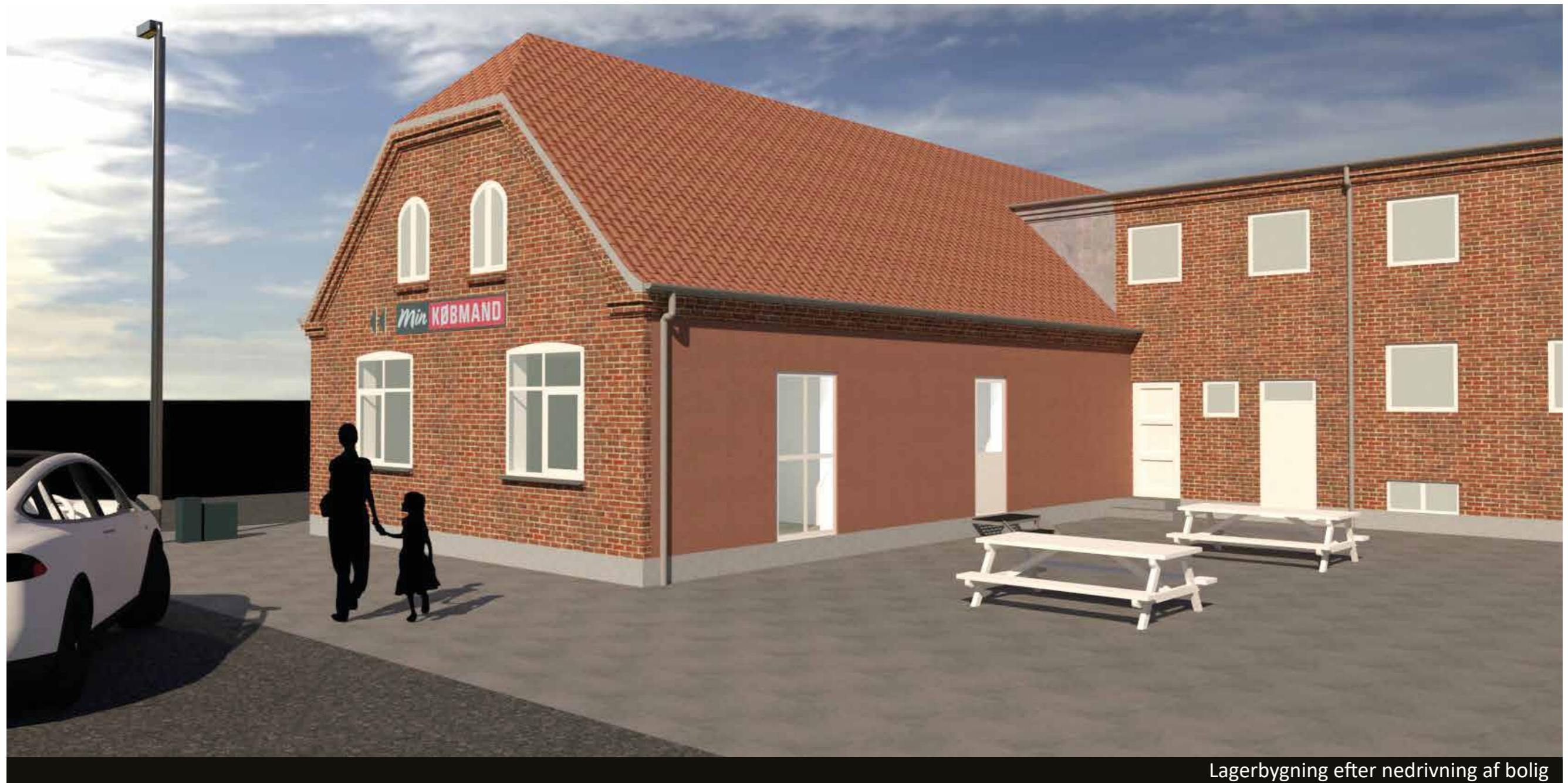
Lagerbygning efter nedrivning af bolig