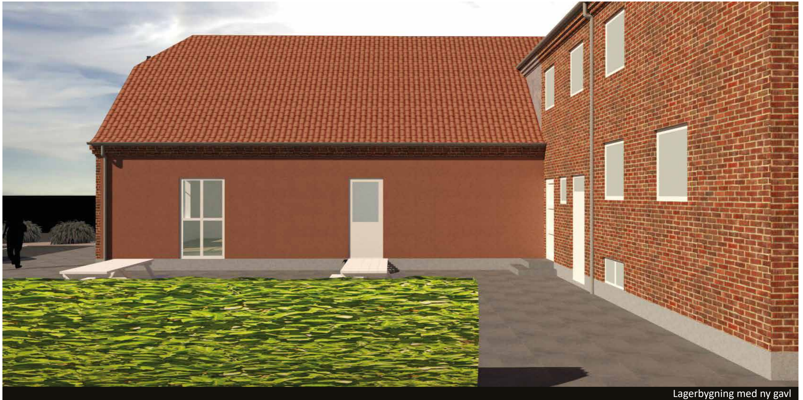
Lagerbygning med ny gavl