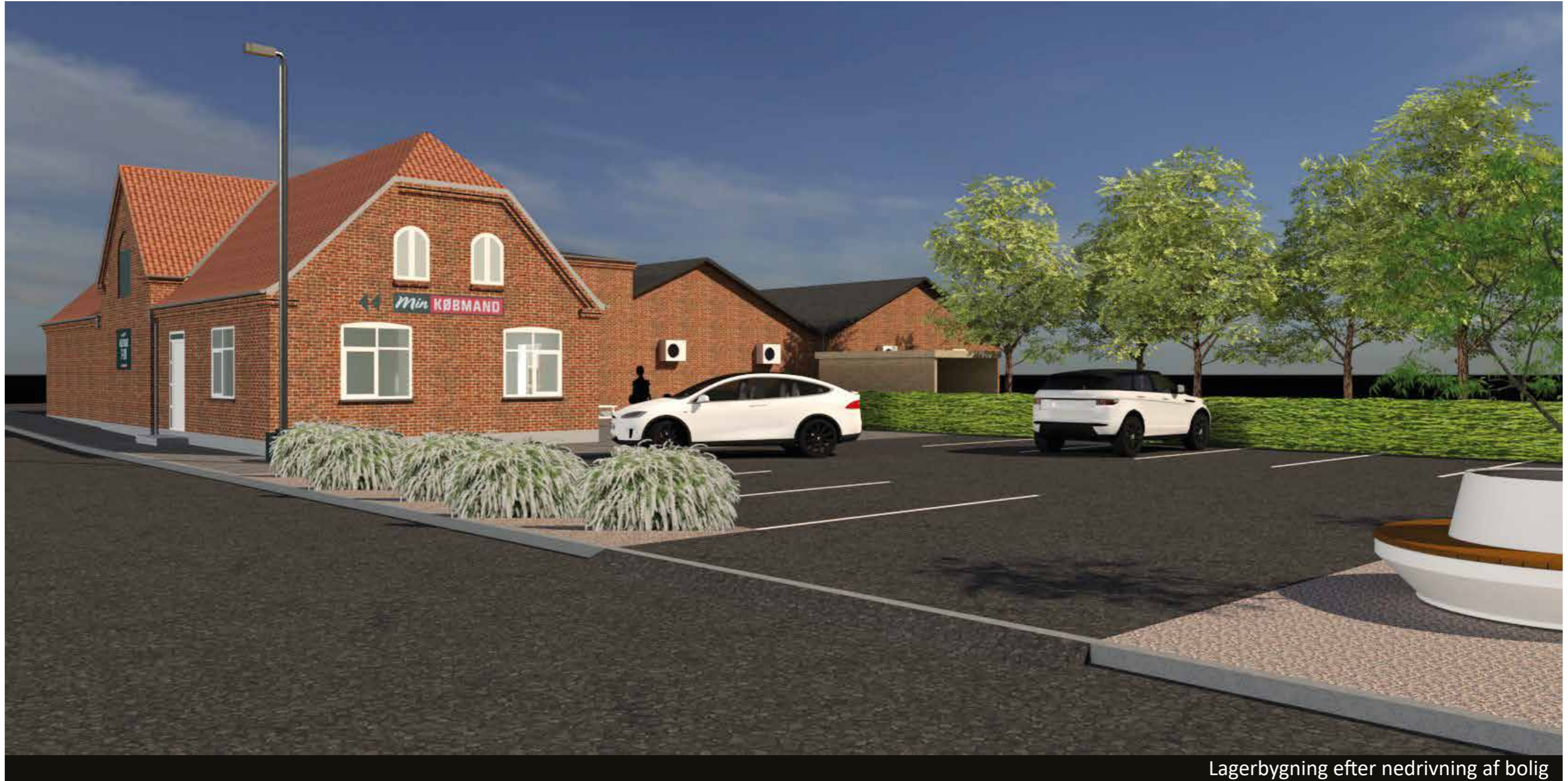
Lagerbygning efter nedrivning af bolig